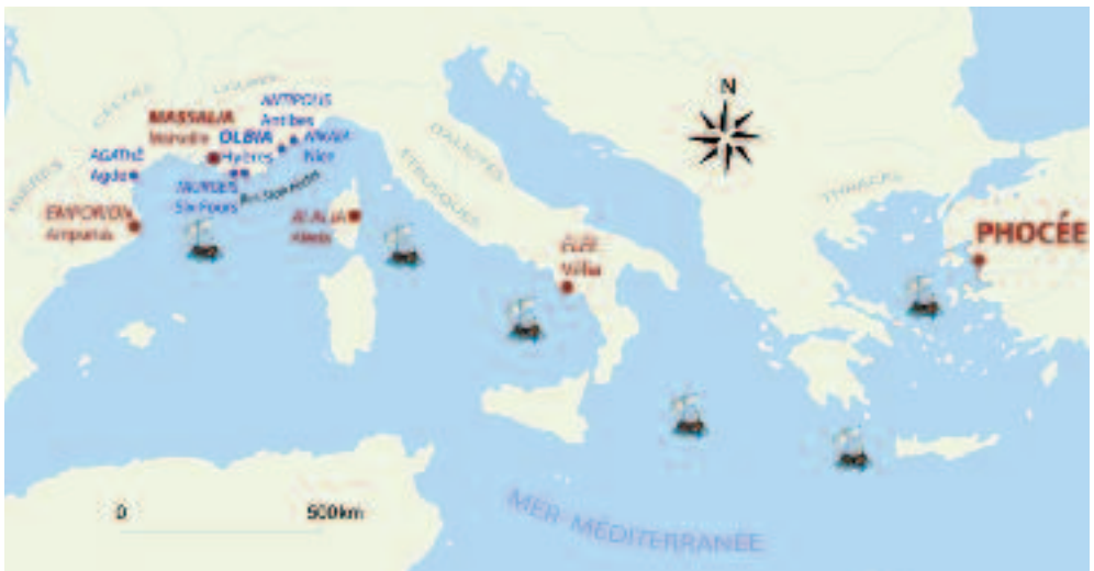
Carte des colonies de Phocée ● et de Marseille ●

Le monde grec antique est un ensemble de Cités-États réunies par une culture et une langue communes. Partis de la péninsule balkanique, les Grecs s'établissent d'abord dans tout le bassin de la mer Égée, dans les îles, et sur les rives de l'Asie Mineure. (Turquie). À partir du VIII e s. av. J.-C., certaines cités fondent des colonies en Italie du sud et en Sicile, puis sur les bords de la Mer Noire. Les motivations de cet essaimage sont à rechercher dans les besoins en terres nouvelles relatifs à l'expansion démographique, à l'accaparement du sol par quelques familles et à l'instabilité du pays. Phocée (importante cité de la côte turque), principalement motivée par des intérêts commerciaux, est l'une des dernières à participer à ce mouvement d'expansion. Au VI e s., elle fonde en Méditerranée occidentale, les colonies de Massalia (Provence), Alalia (Corse), Emporion (Catalogne) et Élée (Campanie). Ces dernières jouent d'abord le rôle de comptoirs ( emporion en grec) dans lesquels les matières premières (argent, étain, cuivre, céréales) et les esclaves, issus de l'arrière pays gaulois ou ibérique, sont échangés contre des produits finis (vaisselle, objets de luxe, vin, huile). Ces comptoirs sont fréquentés par tous les navigateurs méditerranéens, grecs, étrusques ou phéniciens et participent directement à l'accroissement des richesses de leur cité-mère. Lorsque Phocée tombe aux mains des Perses vers 540 av. J.-C., une partie de ses habitants émigre vers les colonies.