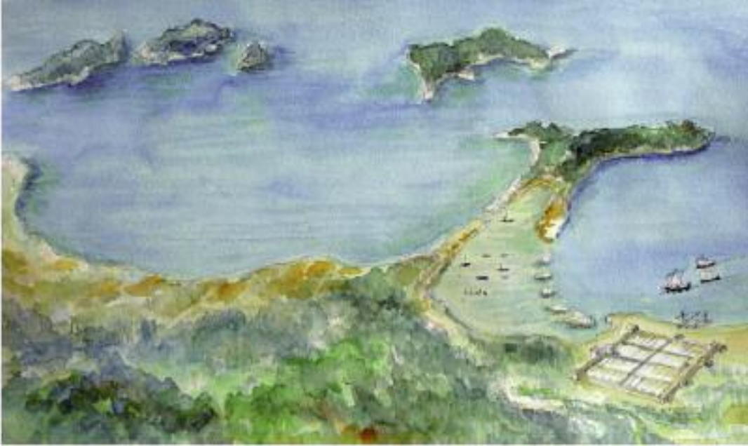
Le tombolo de Giens en formation dans l'Antiquité : hypothèse de restitution.