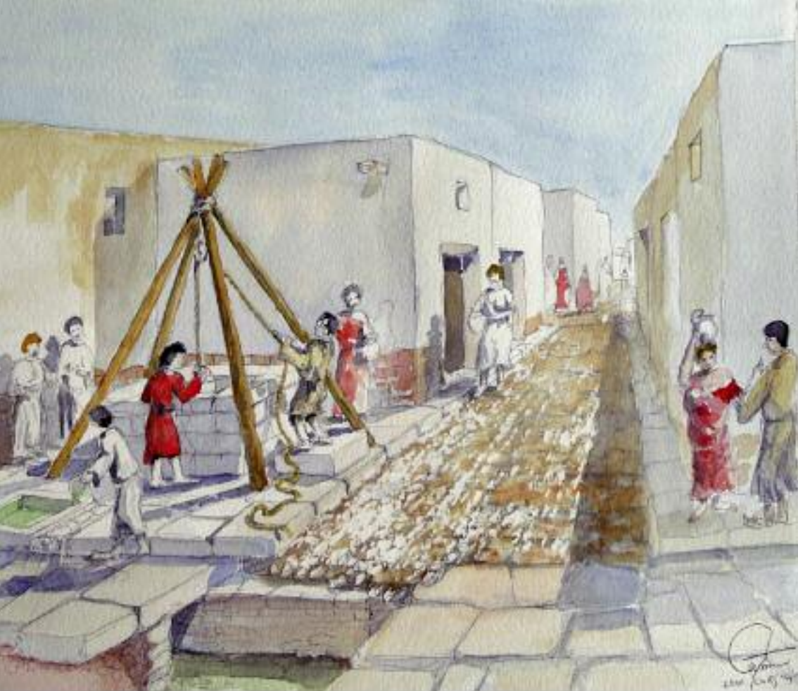
Scène de la vie quotidienne sur la place du puits