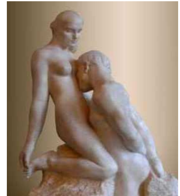
L'éternelle idole 1889 Marbre Musée RODIN Paris