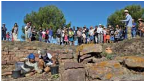
Visite du site par la compagnie PADAM NEZI